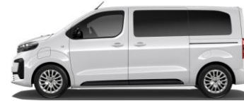
WIT (ICY WHITE) POPR 0,00 (0,00)