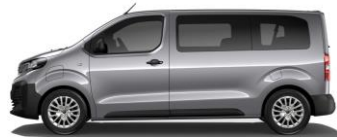
LICHTGRIJS METALLIC (GRIS ARTENSE) M0F4 550,00 (665,00)