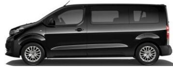
ZWART METALLIC (NOIR PERLA NERA) M09V 550,00 (665,00)