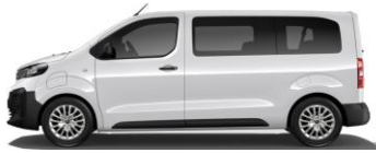
WIT (ICY WHITE) POPR 0,00 (0,00)