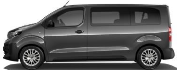
DONKERGRIJS METALLIC (GRIS TITANE) M01J 550,00 (665,00)