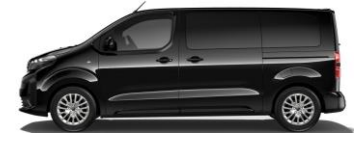
ZWART METALLIC (NOIR PERLA NERA) M09V 550,00 (665,00)